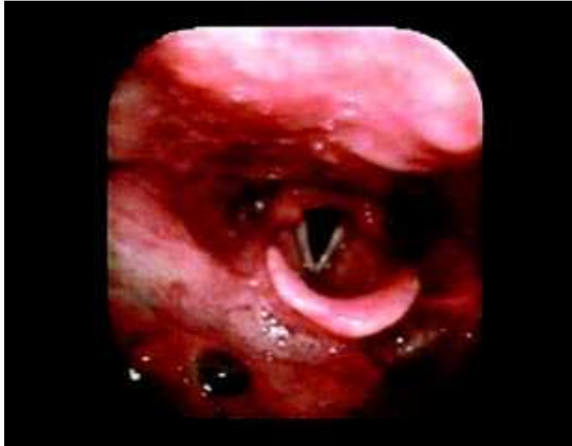
Fig. 2 — Metástases de melanoma maligno na parede anterior da faringe e na fossa piriforme direita.