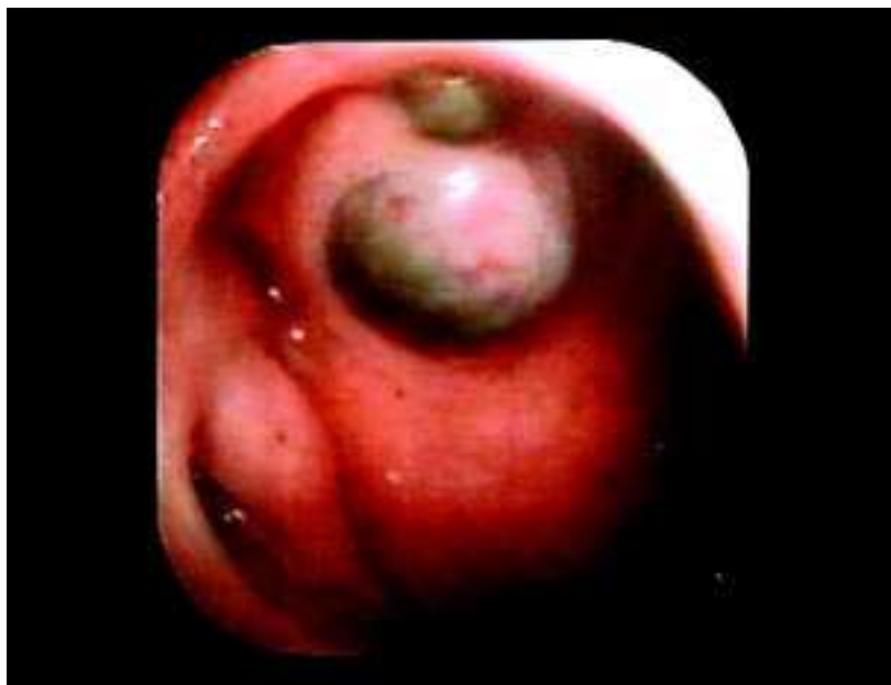
Fig. 1 — Metástases de melanoma maligno na parede posterior da faringe. Observa-se a trompa de Eustáquio e o recesso faríngeo (fossa de Rosenmuller)