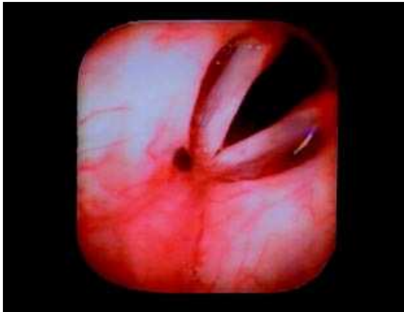
Fig. 3 — Laringe: metástase de melanoma maligno na extremidade anterior da banda ventricular direita.